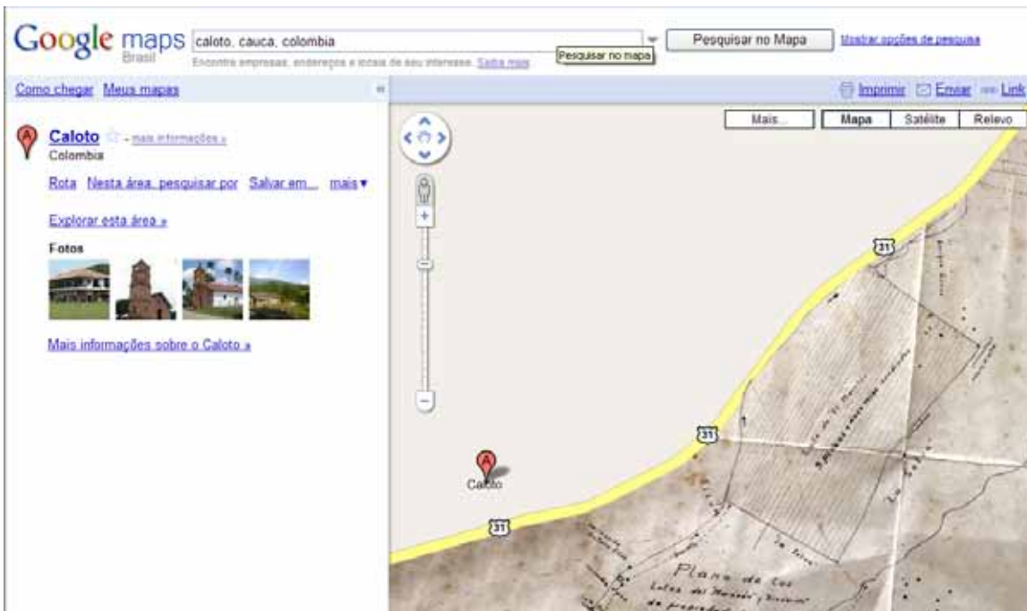
↑ Mapa Global de Caloto, Colombia.

É a partir das problemáticas deste contexto que a definição do local cobra importância, com a intenção de demarcarmos um território a partir do qual nos posicionamos como sujeitos sociais do novo cenário global, ou corremos o risco de perdermos não só dos benefícios da nova sociedade, como de isolarmos ao ponto de nossas economias ficarem em grave crise e desaparecermos não somente simbolicamente, questão que compete à identidade e à arte diretamente.